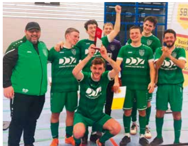
DER FUTSAL-POKAL GEHT AN DEN HÜTTWEG

Beim nächsten Turnier Anfang Januar in Teningen zeigten die Herren wieder eine super Leistung und zogen verdient in die Finalrunde ein. Hier schaffte man es beinahe sogar ins Finale, in dem man der Regionalligamannschaft vom Bahlinger SC im Halbfinal-