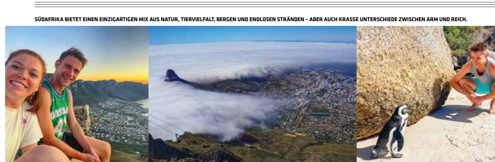
SÜDAFRIKA BIETET EINEN EINZIGARTIGEN MIX AUS NATUR, TIERVIELFALT, BERGEN UND ENDLOSEN STRÄNDEN – ABER AUCH KRASSE UNTERSCHIEDE ZWISCHEN ARM UND REICH.