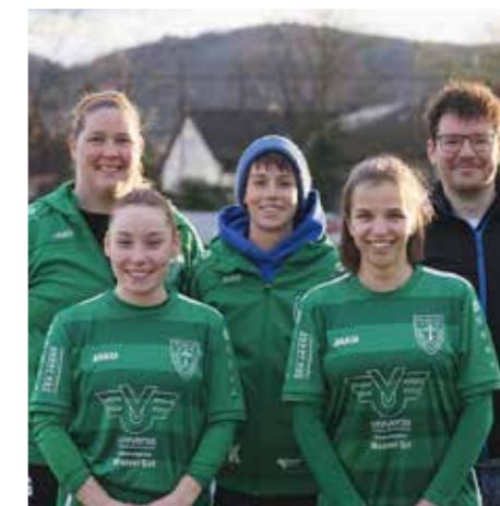
"GEMEINSAM WOLLEN SIE GROSSARTIGES LEISTEN"

Mein Neffe spielt beim FC in der Jugend und meine Schwester wollte mich davon überzeugen, dass ich sein Trainer werde. Ich wollte schon länger wieder an die Seitenlinie zurückkehren, aber nur im Frauenbereich, weil ich dort schon viele Jahre zuvor tätig war. Als ich nach St. Georgen gezogen bin, war dann klar, dass ich erstmal beim FC anknöpfen werde. Die Kommunikation lief dann über verschiedene Kanäle, letztlich kam der entscheidende Kontakt über meinen