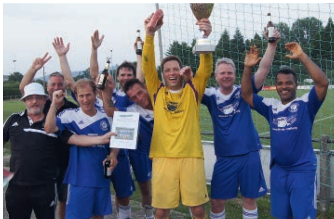
DER DIESJÄHRIGE SIEGER - SV SOLVAY FREIBURG