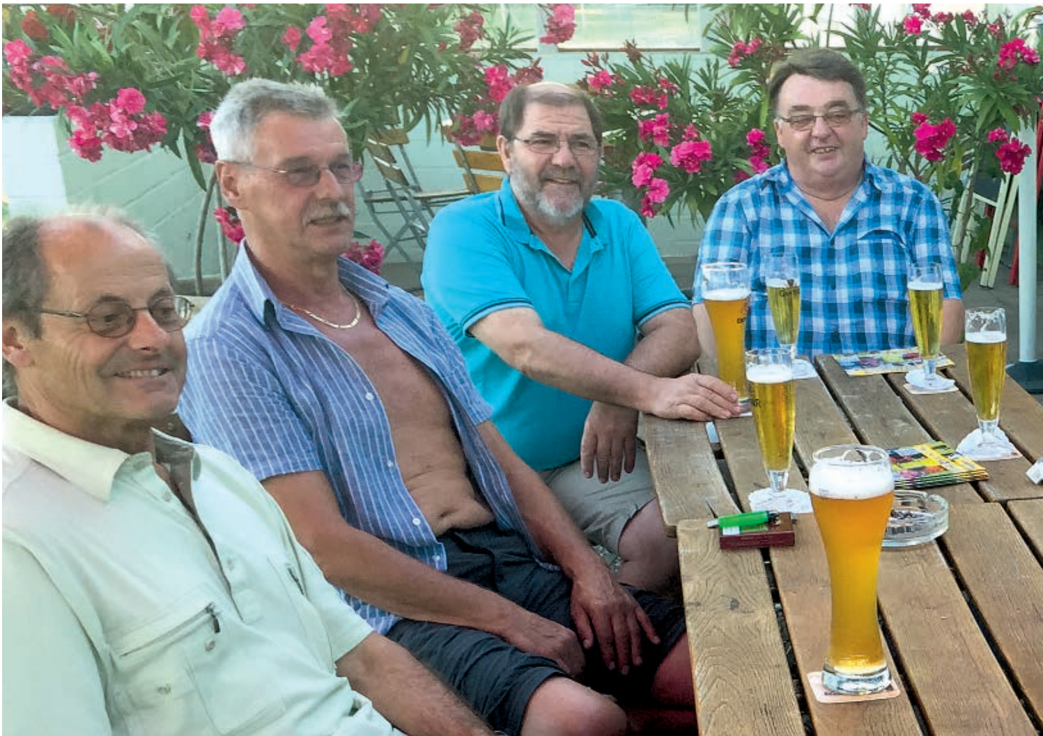
IN GESELLIGER RUNDE WIRD DIENSTAGS DISKUTIERT – NICHT NUR ÜBER FUSSBALL.